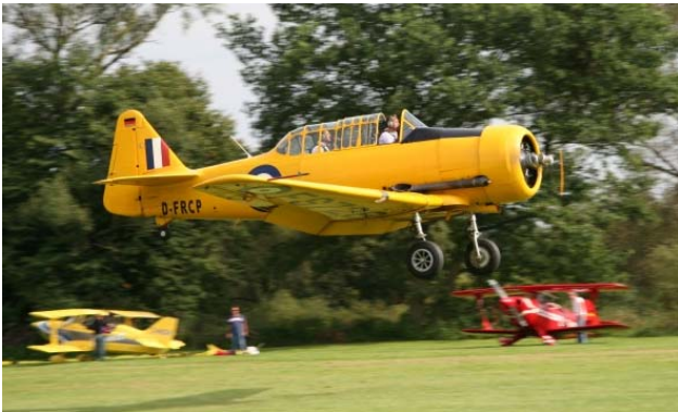
T-6 auf dem Flugtag 2006 in Langenselbold

Außerdem stehen noch weitere attraktive Rundflugzeuge wie Boeing Stearman, T-6, Tragschrauber oder Trike zur Verfügung.