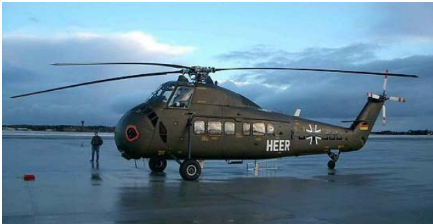
Der wuchtige Transporthelikopter Sikorsky S-58

Da die historischen PS-Boliden erfahrungsgemäß schnell ausgebucht sind, bieten wir unter ACLgs.Flugtag-Reservierung@gmx.de Ticket-Reservierungen für T-6, Boeing Stearman, MH-1521 Broussard oder den Hubschrauber Sikorsky S-58 an.