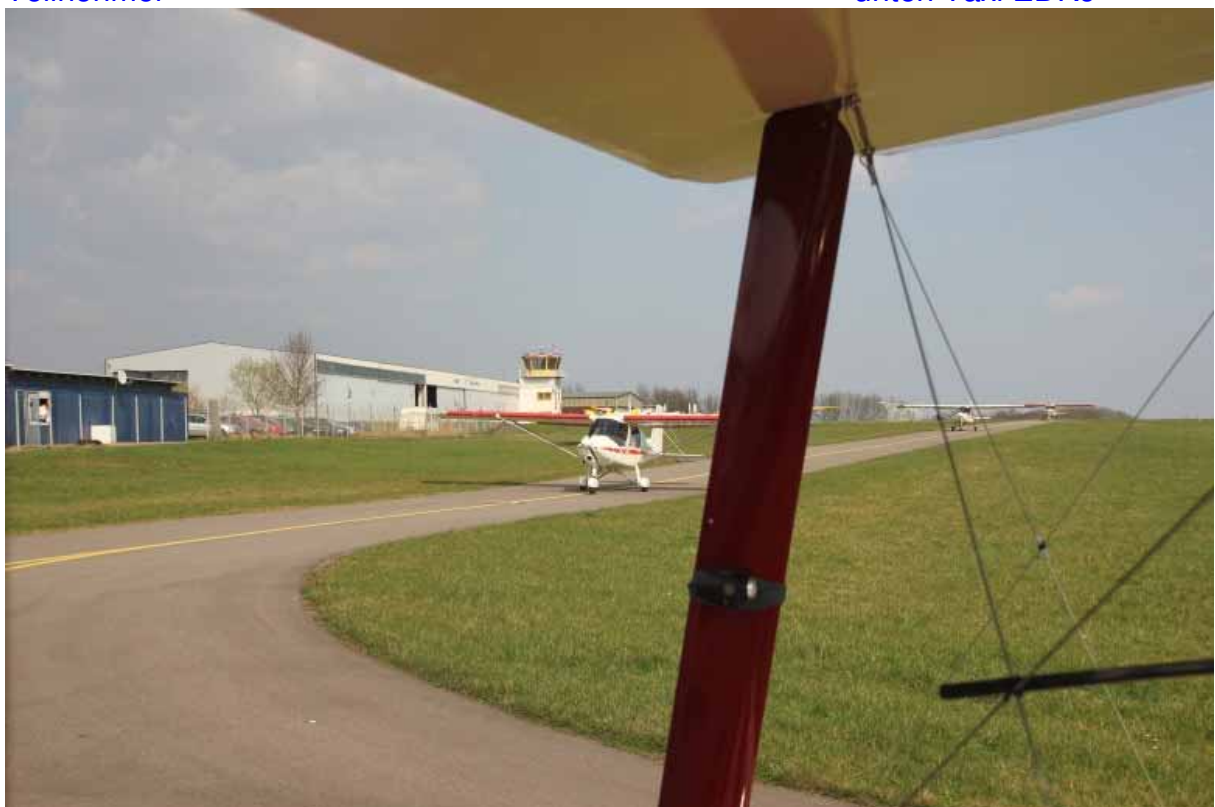
unten Taxi EDRJ